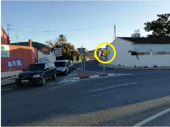
(cartel carretera en círculo amarillo: CV-724 ATENCIÓN TRAVESSERA)